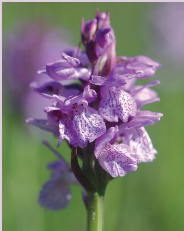
Blütenstand der Torfmoos-Fingerwurz

Die Torfmoos-Fingerwurz wurde erst verhältnismäßig spät als eigene Art beschrieben. Vermutlich ist diese Art auch erst in jüngerer Zeit entstanden. Im Jahr 1927 erschien die Erstbeschreibung des Autors Hans Höppner, der dafür Pflanzen aus Nordrhein-Westfalen zugrunde legte. Er hielt die Torfmoos-Fingerwurz damals für