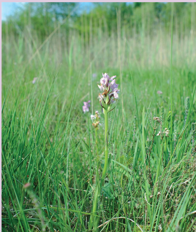
Moorbiotop der Torfmoos-Fingerwurz in Hamburg

Mit dem Rückgang unserer Moore ist diese Art akut bedroht und nach den Roten Listen Deutschlands und der Bundesländer »stark gefährdet« bis »vom Aussterben bedroht«. Ursachen sind Entwässerung, Überdüngung und Verbuschung der Wuchsorte. Durch die isolierten Vorkommen, sowohl der Art als auch der geeigneten Moorbiotop, ist eine weitere Ausbreitung schwer möglich, sodass die verbliebenen Bestände höchste Schützenswürdigkeit besitzen und ihr Erhalt eine wichtige Aufgabe für den Artenschutz in Deutschland darstellt.