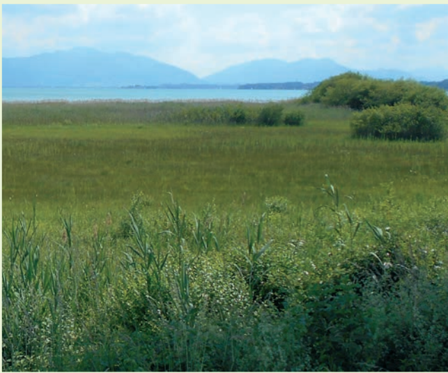
Verlandungszonen am Chiemsee - AHO-Pachtfläche seit 1985

Mit großzügiger finanzieller Unterstützung der Naturschutzbehörden und technischer Hilfe durch die Spezialgeräte der Landschafts-Pflegeverbände und Maschinenringe konnten die empfindlichen Areale weitgehend regeneriert werden, die Populationen haben z.T. Höchststände erreicht. So ist Südbayern weltweit zum Verbreitungsschwerpunkt für diese bedrohte Art geworden.