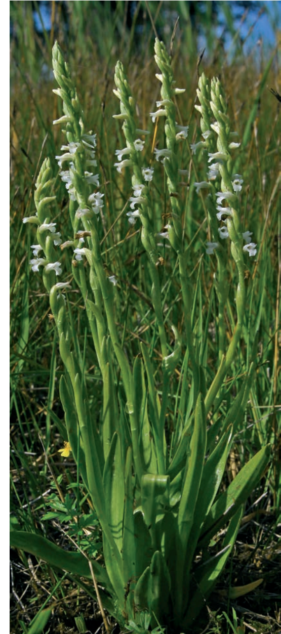
Sommer-Drehwurz Spiranthes aestivalis (Poir.) Rich.