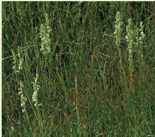
Spiranthes aestivalis im Biotop

auf und kann so in kurzer Zeit in regenerierten Flächen wieder große Populationen aufbauen. Diese sind bei sachgemäßer Betreuung recht robust und überstehen auch längere Überschwemmungen des Wuchsortes selbst während der Blütezeit Mitte/Ende Juli – Mitte August. Äußerst allergisch reagiert die konkurrenzschwache Pflanze