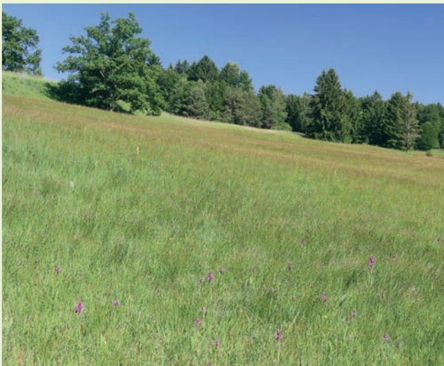
Hangquellmoor in Oberbayern - AHO-Eigentum seit 1991

Mit großzügiger finanzieller Unterstützung der Naturschutzbehörden und technischer Hilfe durch die Spezialgeräte der Landschafts-Pflegeverbände und Maschinenringe konnten die empfindlichen Areale weitgehend regeneriert werden, die Populationen haben z.T. Höchststände erreicht. So ist Südbayern weltweit zum Verbreitungsschwerpunkt für diese bedrohte Art geworden.